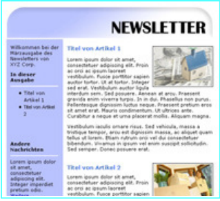
Vielfältige Vorlagen stehen Ihnen bereits im Standard zur Verfügung